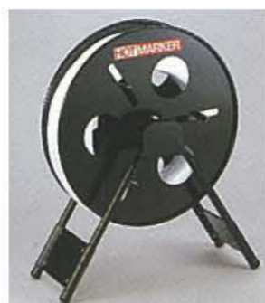
■ C-3 設置型チューブホルダー