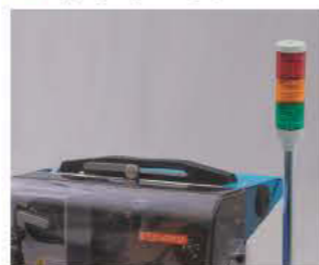
■ 表示灯 運転状態を監視 (出荷時メーカーオプション)