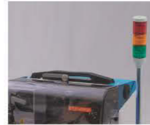
■ 表示灯 運転状態を監視 (出荷時メーカーオプション)