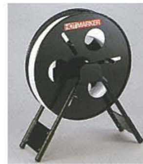
■ C-3 設置型チューブホルダー