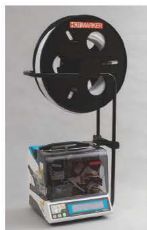
■ TH400 本体上部空間を利用し チューブを安定供給