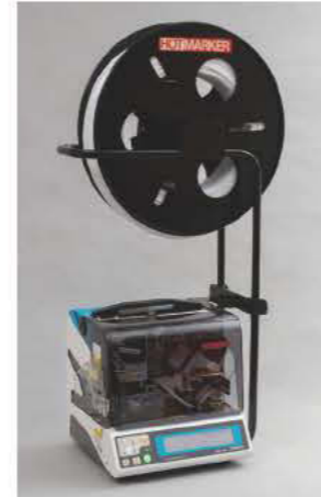
■ TH400 本体上部空間を利用し チューブを安定供給