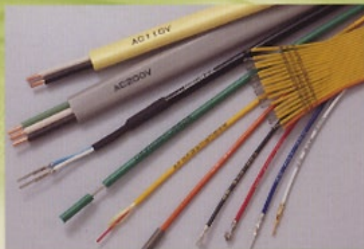
電線・光ファイバー