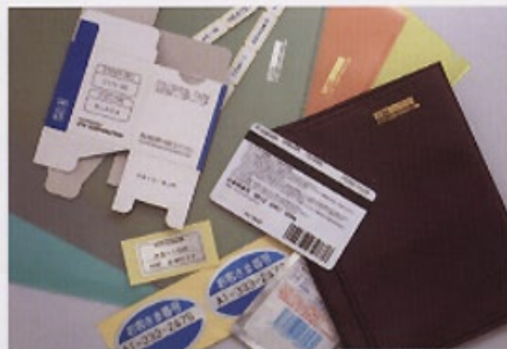
各種シート状材料