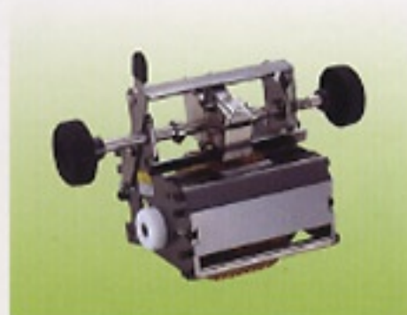
● 回転式活字(Gヘッド)

用途に応じて、回転式活字(G)、差込式活字(T)、ナンバリング活字(N)の活字ヘッドを選択可能