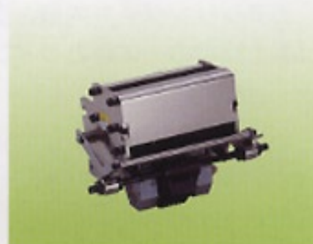
● ナンバリング活字(Nヘッド)