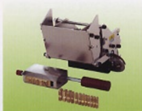
● 差込式活字(Tヘッド)