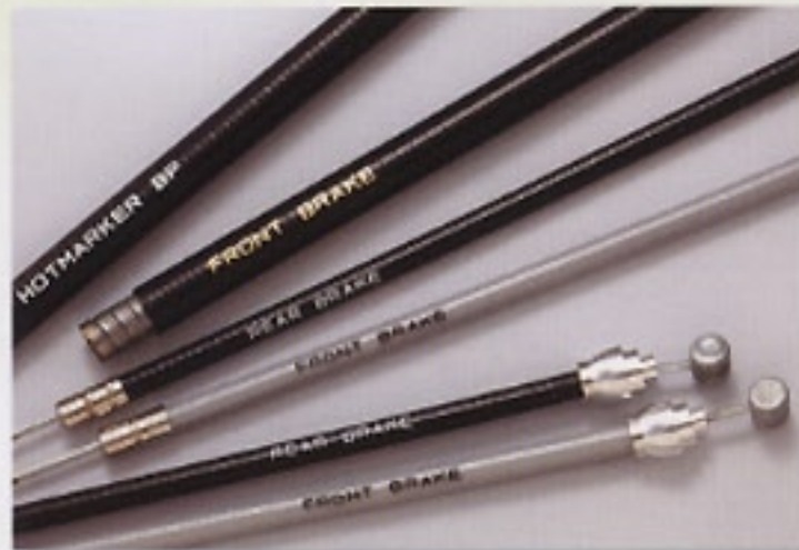
コントロールケーブル・ワイヤー